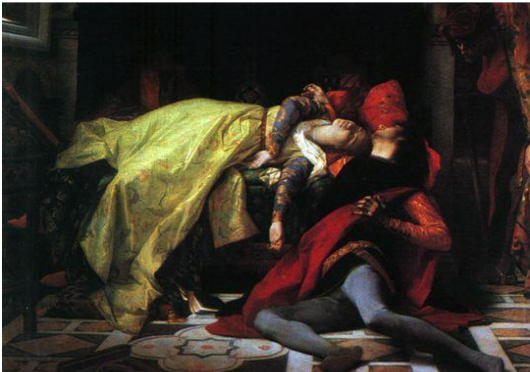
Alexandre Cabanel, 1870, Paris, Musée d'Orsay