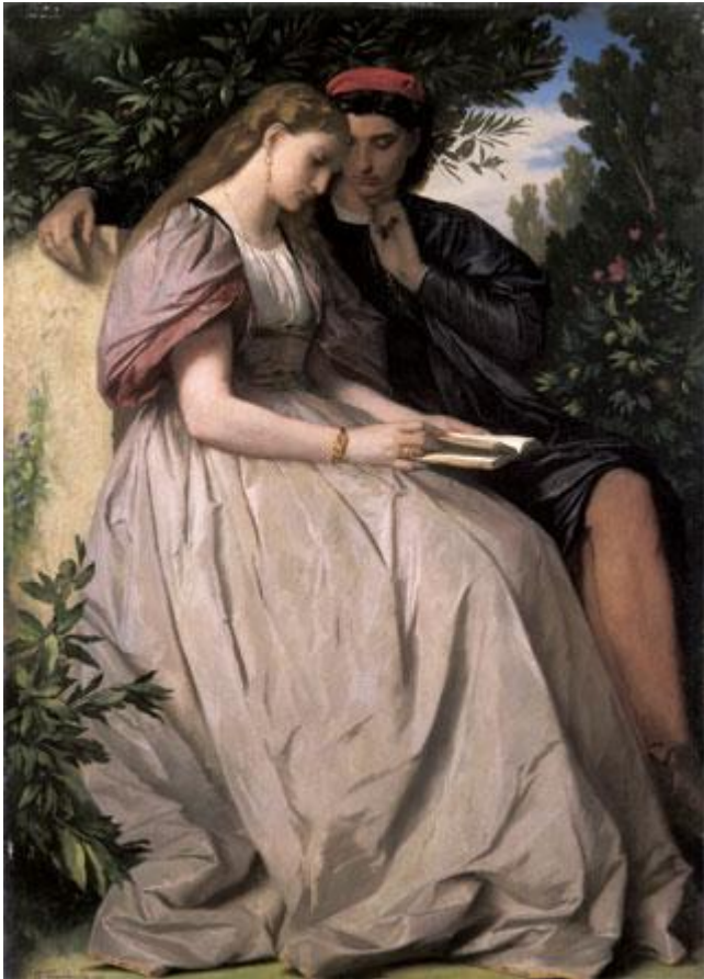
Anselm Feuerbach, 1864, Munich, Bayerische Staatsgemäldesammlungen